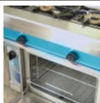
Pece a pánve